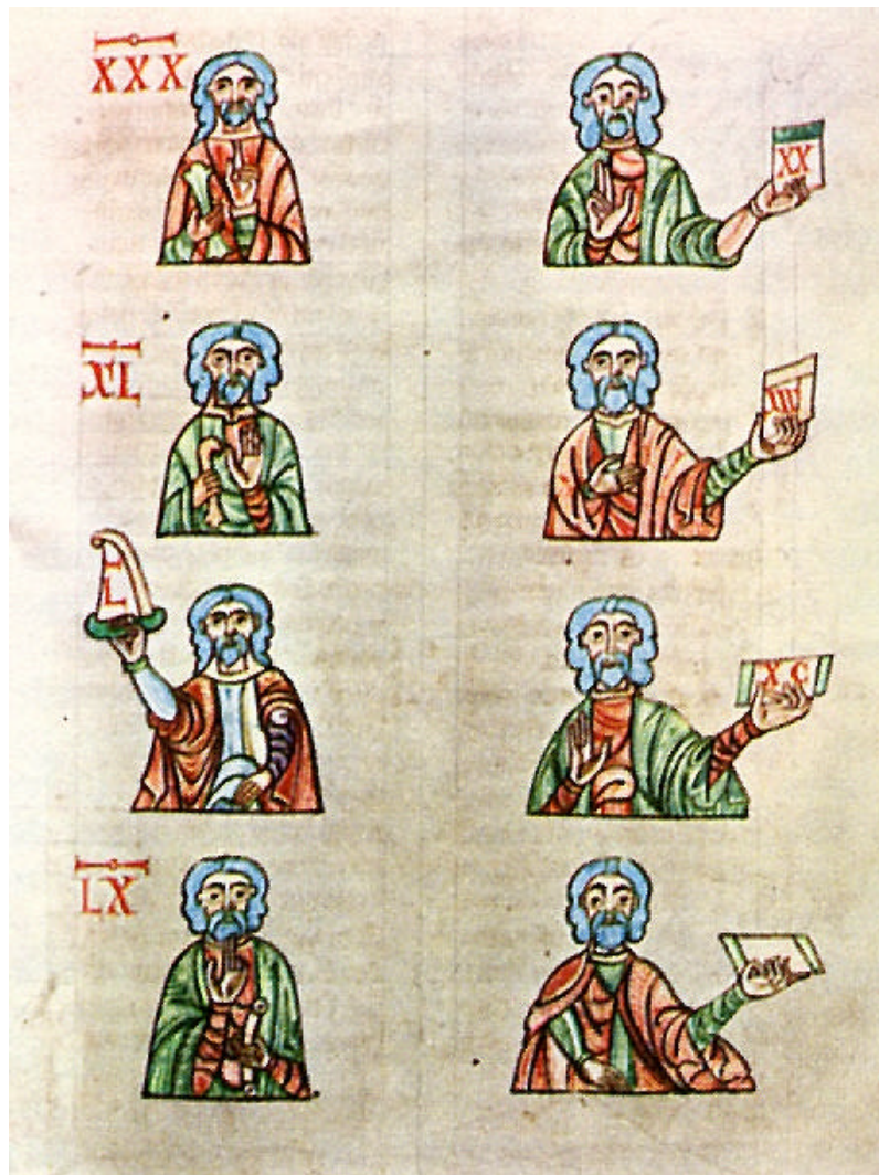
De Numeris ou a arte de contar pelos dedos, códice alcobacense nº 426, secs. XII-XIII