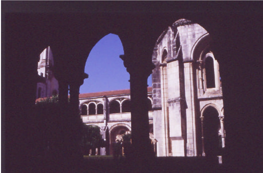
Vista do claustro do Mosteiro de Alcobaça

Quando os primeiros monges vieram ocupar as terras regadas pelas ribeiras Alcoa e Baça, em meados do século XII, a região estava desertificada, à parte alguns mouçárabes que tinham ficado após a retirada do povo islâmico. As fronteiras de Portugal não estavam definidas e a região vivia uma situação ainda muito instável, com frequentes incursões de guerreiros mulçumanos. Há notícia de os monges terem sido massacrados numa dessas investidas, cerca do ano de 1190. Pelas regras impostas pela ordem, os frades deviam garantir o seu sustento, através do trabalho da terra, pelo que foi necessário desbravar os terrenos incultos, secar pântanos, fertilizar a terra. Durante o primeiro século em Alcobaça a vida dos monges foi dura, dividindo-se entre a construção da abadia, a exploração agrícola – no que aliás eram reconhecidamente bons – e a fixação de colonos nos seus domínios (Gusmão, 1992; Saraiva, 1983).