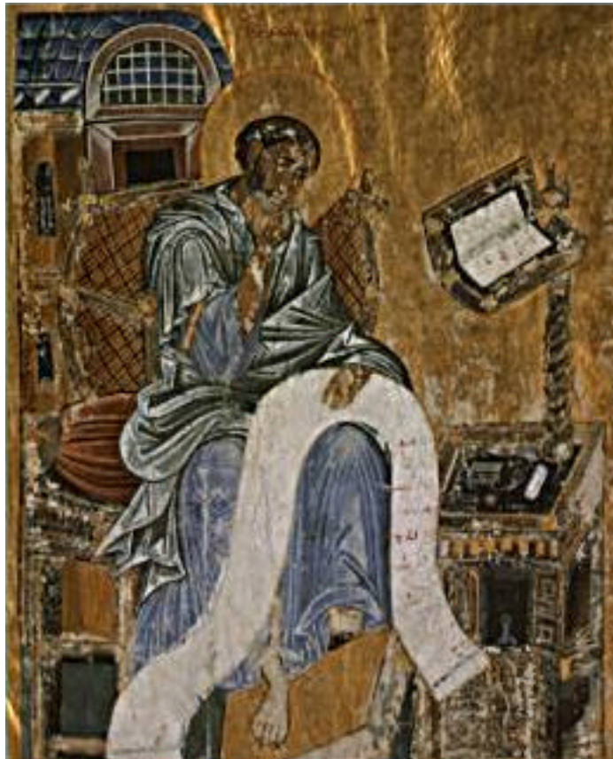
S. Marcos a escrever os evangelhos. Ilustração de um manuscrito bizantino do século XIII

Surgiu assim uma diversificação das classes sociais com o aparecimento da burguesia. Esta classe nascente está sobretudo interessada no comércio e precisa de algum saber para gerir os seus negócios. A nova situação vai dar um incremento às escolas leigas e aos estudos liberais. Surgem escolas ligadas a confrarias que, além de ensinarem e regulamentarem os ofícios, ministravam as primeiras letras e os rudimentos de aritmética.