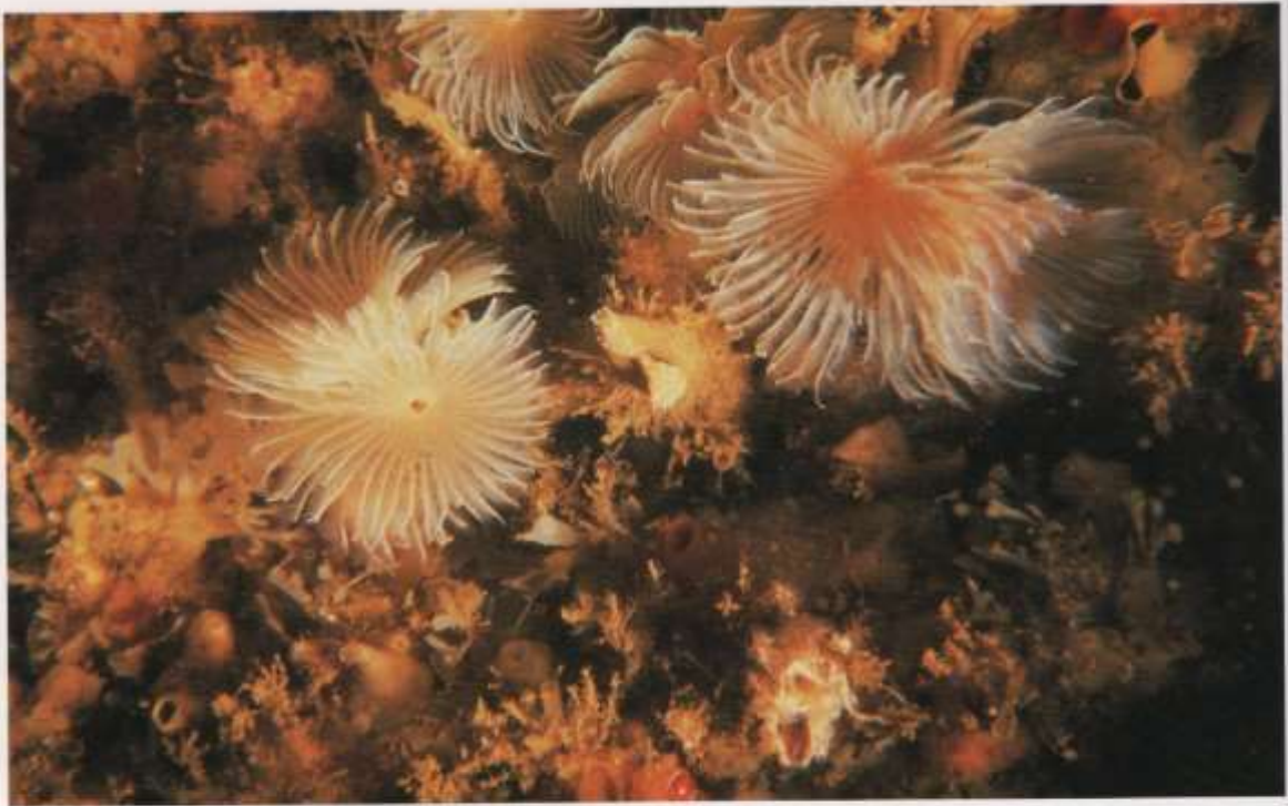
Alguns dos poliquetas são sedentários.