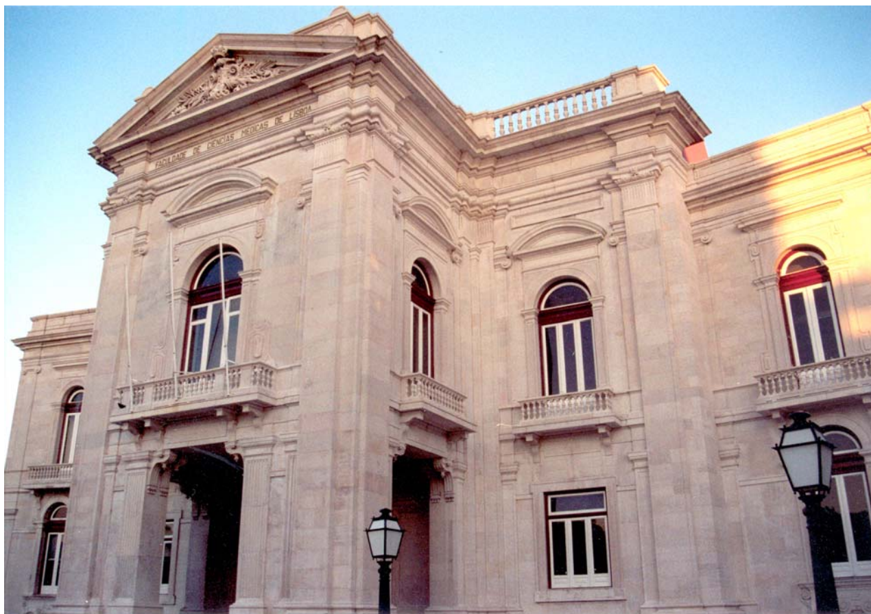
Faculdade de Ciências. Universidade de Lisboa. Lisboa